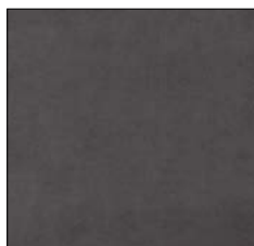
DARK GREY A103