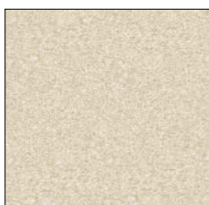
VANILLA ICE F050

La coloritura estranea dovuta a cuscini e/o tessuti di abbigliamento non è un difetto del materiale di rivestimento. Le deviazioni di colore e di struttura sono tipiche della merce e non danno diritto a reclami. L'interazione di pressione, calore e/o umidità può provocare cambiamenti più o meno evidenti della posizione del pelo (punti di pressione). Questo aspetto, definito anche impronte di seduta o punti lucidi dovuti all'uso, è una caratteristica tipica del rivestimento e non rappresenta una riduzione della qualità.