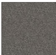
DARK GREY F057