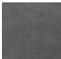
DARK GREY P701