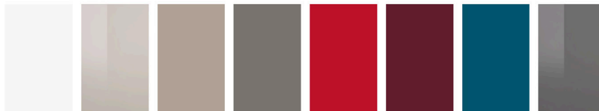
bianco tortora sabbia grigio polvere rosso bordeaux petrolio piombo