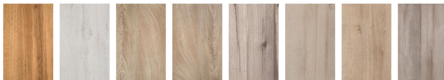
rovere nodato 485 quercia ghiaccio 796 quercia beige 798 quercia tabacco 797 acero nodato acero chiaro acero beige acero grigio