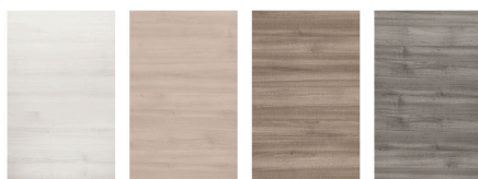
ghiaccio naturale caribe argilla