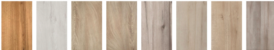
rovere nodato 485 quercia ghiaccio 796 quercia beige 798 quercia tabacco 797 acero nodato acero chiaro acero beige acero grigio