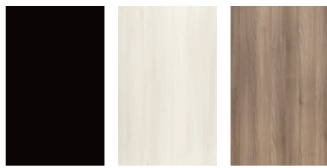
nero rovere bianco rovere nocciola