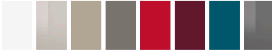
bianco tortora sabbia grigio polvere rosso bordeaux petrolio piombo