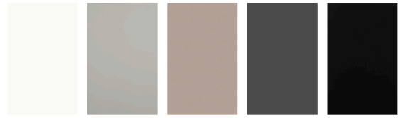
bianco grigio nocciola grafite nero