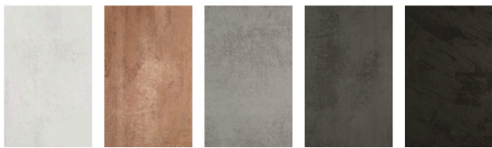
cemento bianco 511 cemento bronzo 509 cemento grigio chiaro 489 cemento grigio scuro 484 cemento nero 488