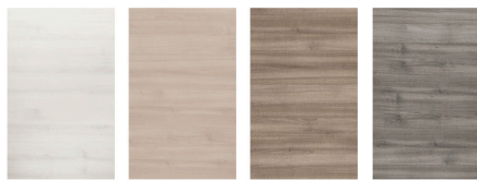
ghiaccio naturale caribe argilla