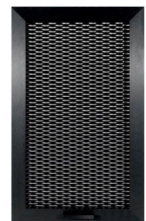
anta con telaio in alluminio anodizzato nel colore nero e griglia in alluminio, spessore 22 mm